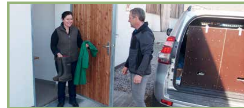
Saubere betriebseigene Kleidung sollte den Tierärzten oder anderen betriebsfremden Personen zur Verfügung gestellt werden.