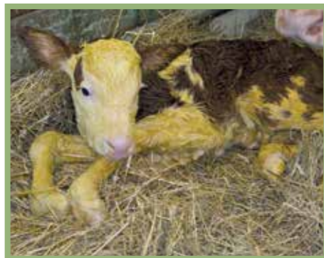
Schnellstmögliche Trennung von Kuh und Kalb nach der Geburt