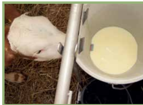
Kälber mit sauber gewonnenem Erstkolostrum von MAP-negativen Kühen tränken