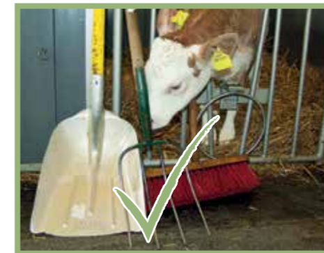
Separate Arbeitsgeräte für den Kälberbereich notwendig Kein Kuhkot an Arbeitsgeräten im Kälberstall