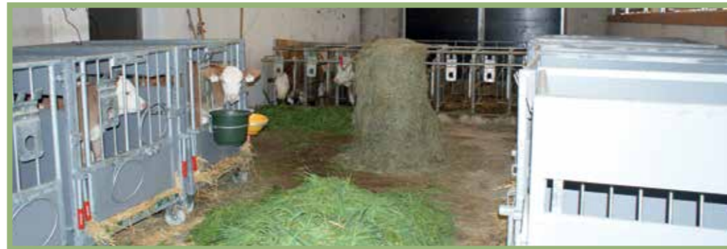
Bestmögliche räumliche Trennung des Kälberbereiches vom Kuhbereich